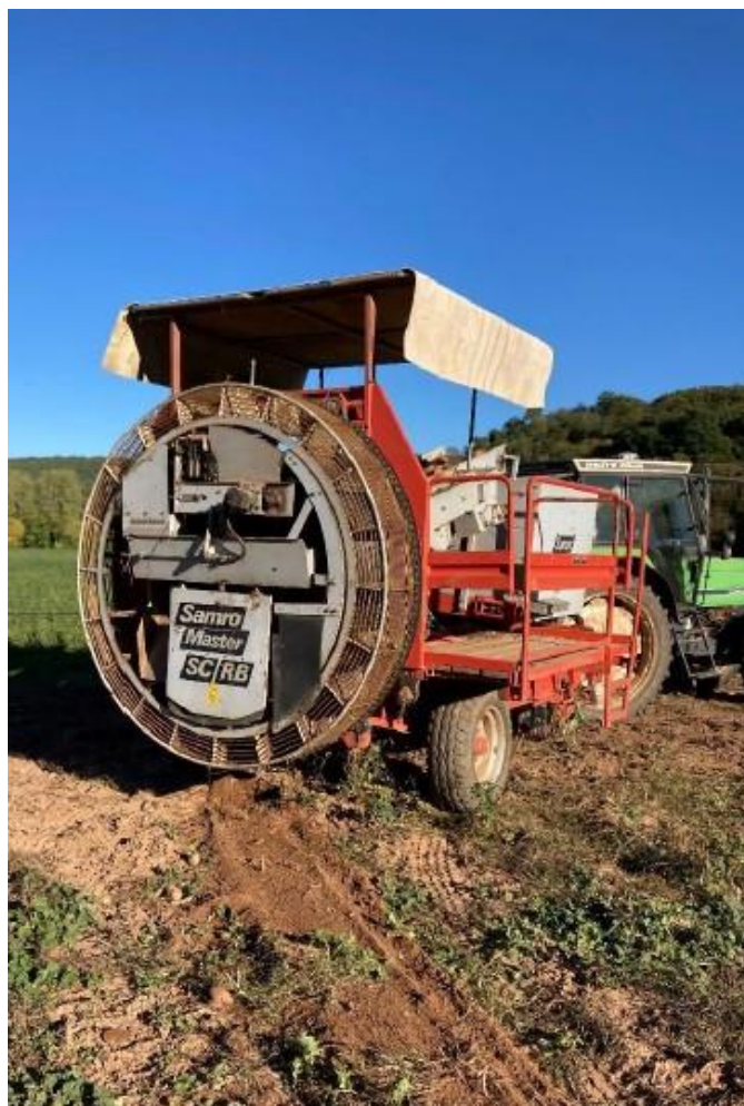
Récolte du 25 août