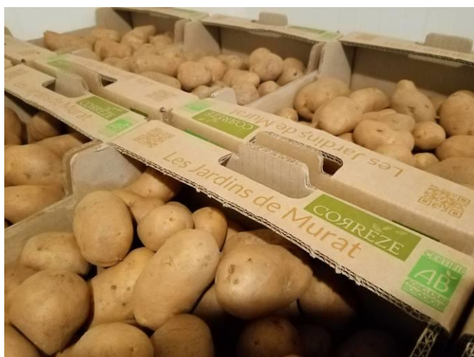
Plateaux prêts pour l'expédition