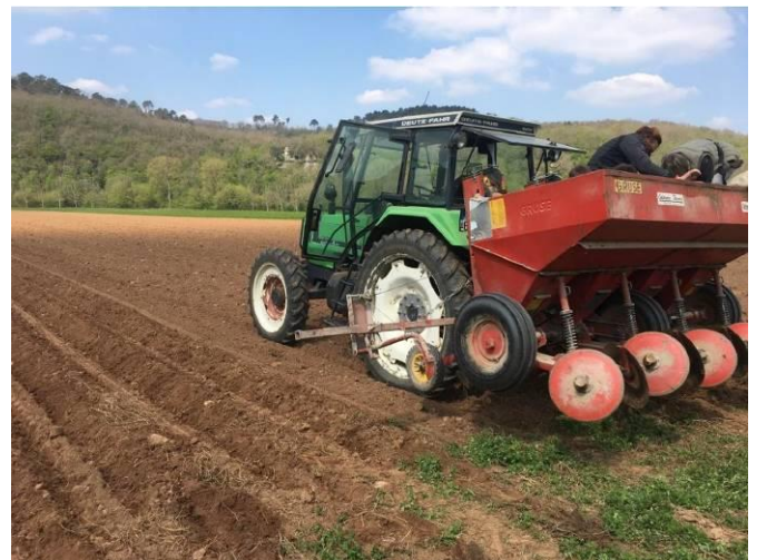
Plantation du 17 mai