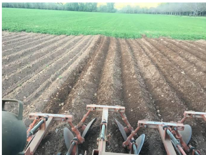
Rebutage du 27 mai (@F.Trignol)