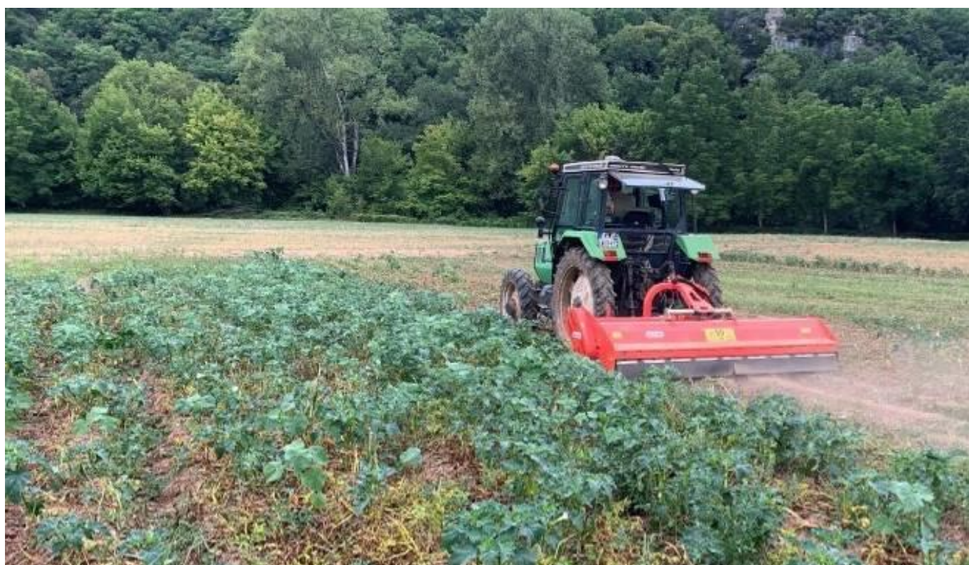
Défanage des pommes de terre du 10/08