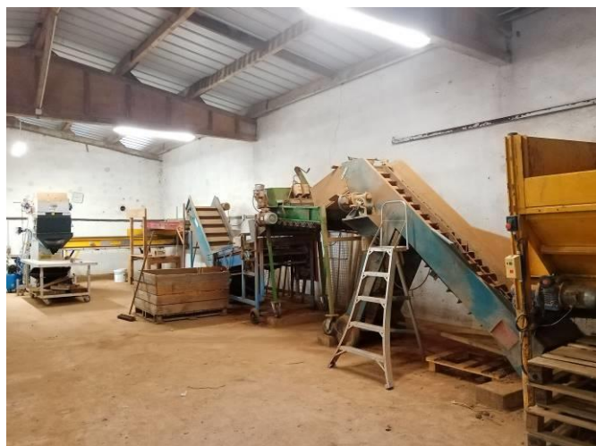
Chaîne de conditionnement du lycée agricole de Brive Voutzac