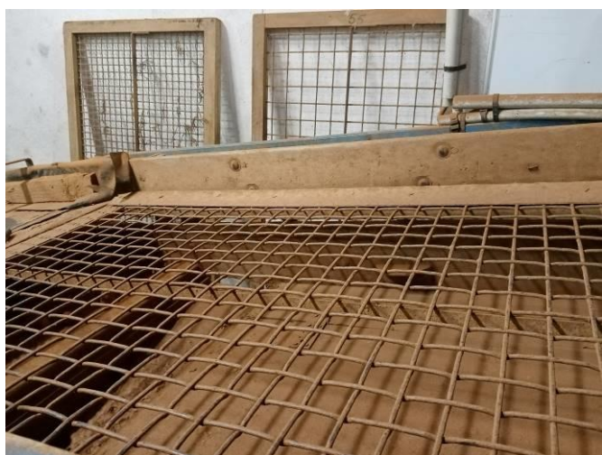
Grille de calibrage du lycée agricole de Brive Voutezac