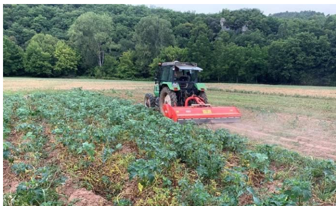
Défanage des pommes de terre du 10/08