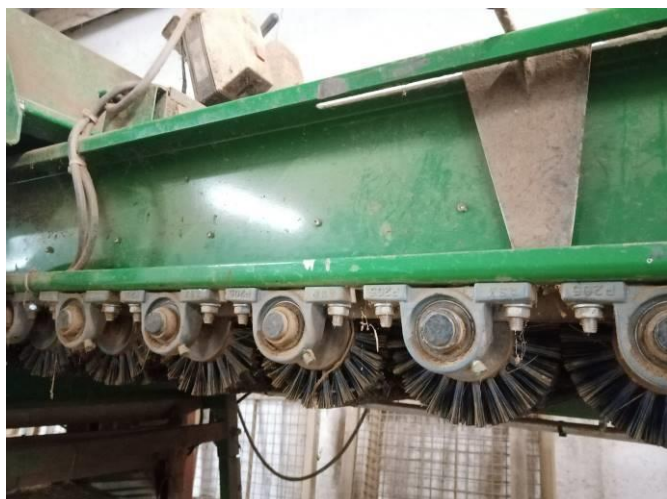
Brosseuse du lycée agricole de Brive Voutezac (@AL.Fuscien)